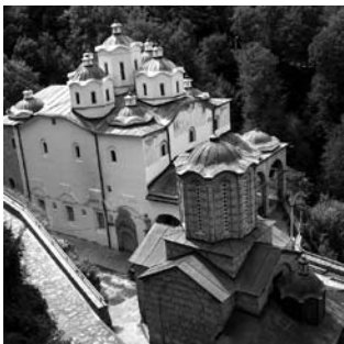
Св. Јаким Осоговски, Крива Паланка