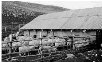
Бачило на Шар Планина

Поделелството е претставено со справи, алатки и прибор за подготвување на почва за засејување житни култури (рала, јареми, гужви, токмаци – пупалиња). Справи и прибор за сеене житни култури (брани), алатки за жнеење (српови, паламидарки, колчиња – витли). За пренос на слама и сено (набодњи, врзми, дрвени коли со две и со четири тркала, сањи). За вршење и веене житни култури, чукање 'рж (куки, вили, гребла, метли, лопати – дрвени, дрмно, решета, фрчачки – чукалки, дикањи). Мелници за жито и садови за чување жито, житно семе, храна и слама (шиници, кутли, коруби, бучуци, кошеви, амбари). Прибор за ронење пченкарни класови (кош, троначка, леса, боаљка). Земјоделските алатки и прибор се рачни изработки со исклучок на металните делови кои се фабричка или ковачка изработка. Збирката Народно стопанство располага и со алатки за различна намена, предмети како личен прибор и макети на воденици: динга, коло со долап – чарк, даљани, мандри, бачила, чунови и др.