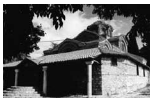
Св. Климентij Охридски