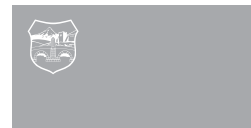
Грб и знаме на трогош Скопје