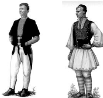
Машка џаличка носија Машка мариовска носија Црџеџиџе се џозајмен од изданиеџо: „Македонски народни носии“, Еџнолошки музеј – Скопје, 1963 џодина

џойонимијаџа , науката за имињата на географските места, има свои етнографски белези.