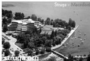
Хошел Дрим, Струга