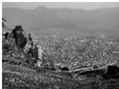
Маркови кули (Варош), Прилеп

Според Марко Цепенков, до престолнината на Крали Марко – Варош почнале да се доселуваат луѓе и да градат куќи кои биле прилепени до ѕидините на Варош. Новиот град изгледал како ПРИЛЕПен на Варош, па оттаму го добил името Прилеп.