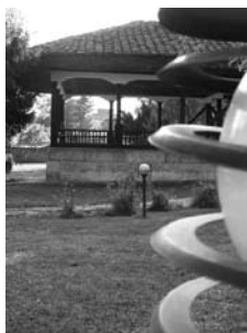
Арабаши баба шеке, Тешово