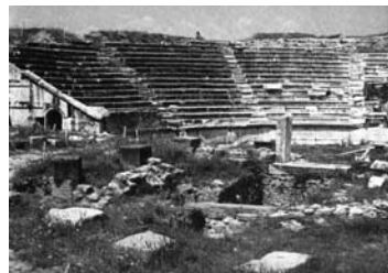
Амфишеатар во античкиот град Стоби

По падот на античка Македонија под римска власт, овие градови биле уништени и ограбени. Но сепак, новата римската цивилизација го продолжила развојот на овие градови. Римската култура длабоко се врежала во градските јадра на некогашните македонски градови. Се граделе нови патишта кои поврзувале големи градски центри во Римската Империја. Значаен дел од овие сообраќајници ја крстосувале територијата на Македонија. Најпознат ваков пат е Виа Егнација, кој минувал низ Лихнид, Хераклеја и Солун. Во овој период македонските градови доживуваат културен и економски развој. Од археолошките наоди во овие градски центри пронајдени се базилики, театри, плоштади, палати, бањи, кои биле богато декорирани со мозаици, мермерни и бронзени скулптури, како и со архитектонски орнаменти.