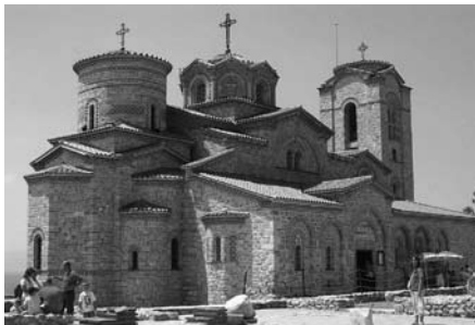
Црквата на Плаошник, Охрид

Христијанските храмови од средновековниот период се надалеку познати по градителската вештина, по репрезентативниот фрескоживопис и по врвното мајсторство на нивните познати и непознати градители. Опелани во поезијата, во многубројните патеписи и приказни, нашите средновековни цркви – чувари на неимарската традиција и древното сликарство, се најсликовитиот репрезент на убавото од македонската средновековна традиција.