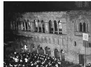
Охридско лето: анџички шејшар и Св. Софија