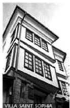
Куќи во Охрид

Во одделните региони има значителна разлика помеѓу архитектурата на куќите, материјалот, големината на објектите, бројот и распоредот на просториите, обликот и големината на прозорците и на покривот, украсите на фасадите и другите елементи.