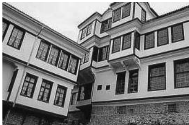
Куќаша на Уранија (лево) и куќаша на семејството Робевци (десно), Охрид