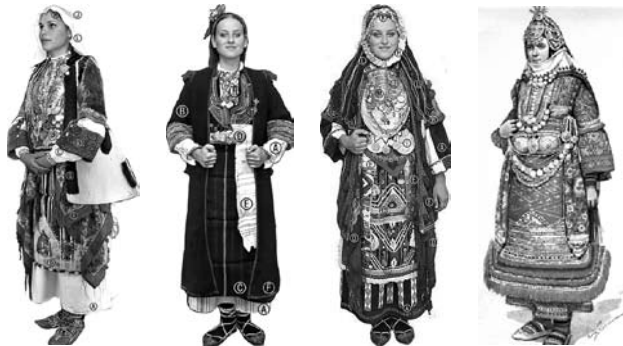
Женски носии од Охридско, Пијанечко, Скопско, Биџолско

Богатството на народните носии и накит, разликите во одделните облеку, како и во целокупното народно облекување и украсување, се изразени во стилската композиција на носијата и во бројноста и разновидноста на облеките и нивното украсување. Во оваа смисла особено се убави и богати носиие од западна и средна Македонија, а меѓу нив посебно се истакнува женската. По богатството и украсувањето на облеките се издвојуваат: џразничниџе, обредниџе и свечениџе носии , во кои најдолго се зачувани старите традиции, а творечкиот дух на народот достигнал врвен израз.