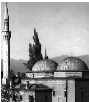
Мустафа-пашина џамија, Скопје

Од периодот на Отоманското Царство, на територијата на Р. Македонија во периодот од 15 до 19 век се изградени многу џамии и други муслимански верски објекти и споменици (теке, турбе). Некои се препознатливи по архитектурата и духовноста на градбата.