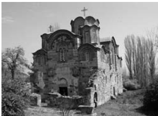
Св. Ѓорѓи – Старо Наторичане