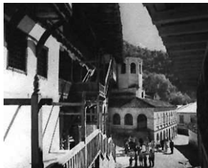
Св. Јован Биџорски, Дебарско