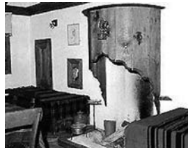
Ентериер во старата градска куќа

Народнаша архитектура во Македонија достигнува најголем развој во периодот на 19 и почетокот на 20 век. Специфичностите на градската и селската архитектура произлегуваат од особеностите на теренските услови, изборот на градежниот материјал, градителската традиција, економската моќ и големината (потребите) на семејството. Оваа оригинална архитектура е динамична, практична, има богат колорит и живост кои се одраз на креативноста и стилот на живеење во семејството.