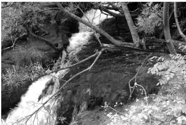
Извориште во Вевчани

Изворите во Вевчани се доволна атракција и убавина за таму да се помине дел од одморот, да се впије прекрасната глетка на бескрајното зеленило и жуборењето на бистрата вода. Дрвените мовчиња, маси и клупи ја зголемуваат романтиката на просторот. Пионерите за селскиот туризам во Вевчани се угостителите чии кафеани пленат со автентични селски детали, кои се вкусно вклопени во селскиот амбиент. Освен тоа, во Вевчани се подготвени и многу интересни содржини за туристите.