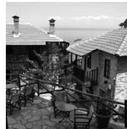
Обновени селски куќи во традиционален стил

Селскиите населби , во зависност од локацијата и поставеноста на објектите, можат да се поделат на збиени и раштркани . Куќите најчесто се изградени од делкан камен, или од тули, од непечена или печена земја кои се поврзувани со посебно подготвена земја. Покривите порано биле од камени плочи или ќерамиди.