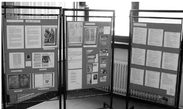
Пано со приказ на истражување