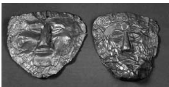
Златнише маски од Требеништа, Охридско

Во тоа време во Македонија биле развиени повеќе градски центри: Скупи, Стибера, Стоби, Хераклеа Линкестис, Лихнидос и др. Но, на територијата на Република Македонија постојат бројни помали локалитети каде е пронајден богат археолошки наод, кој сведочи за распространетоста на античката култура во Македонија. Во сите овие многубројни археолошки локалитети се пронајдени големи количества на подвижен материјал, како на пример: керамика, монети, орудија, накит, статуи во помали и во поголеми димензии, оружје и сл. Овие богатства се чуваат во поголемите музеи во Република Македонија.