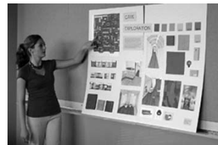
Презентација на истражување