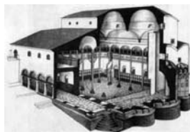
Св. Пантелејмон, Велес (скица)

Базилика е јавна зграда за собири со римска архитектура, односно има правоаголна основа и по должината обично е поделена на три дела или кораби , од кои средниот главен дел се завршува со апсуга . Базилика воедно се нарекува и свечената сала во царската палата, во бањите и домовите. По примерот на римските, се граделе и старохристијанските базилики, во кои апсидата претставува простор за свештенството и олтарот.