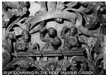
Иконостас од црквата Св. Спас, Скопје и детал од резбајта – мајсториште