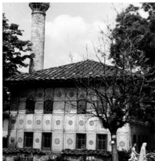
Шарена џамија, Тешово