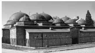
Дауџ–пашин амам, Скопје