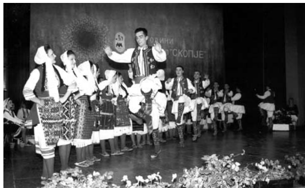
Етнoлошки белези: Оро оџ Поварџариџо

Меѓу убавите тетовски староградски песни се: Џан џигер Магдо, Чукав, чукав дур омалев, Кажу Епсо Димушева, Срце ме боли ќе умрем, Благоњо дејче Пожаранче, Сардисале Лешочкиот манастир, Ѓорушице црно око, Огреала месечина, „Ој, девојче, девојче“ и други. Овие песни се мотивирани од секојдневниот живот и даваат непосреден приказ не само на една животна и психолошка стварност, туку и белег на историските и општествените прилики на средината и времето во кои се создавале.