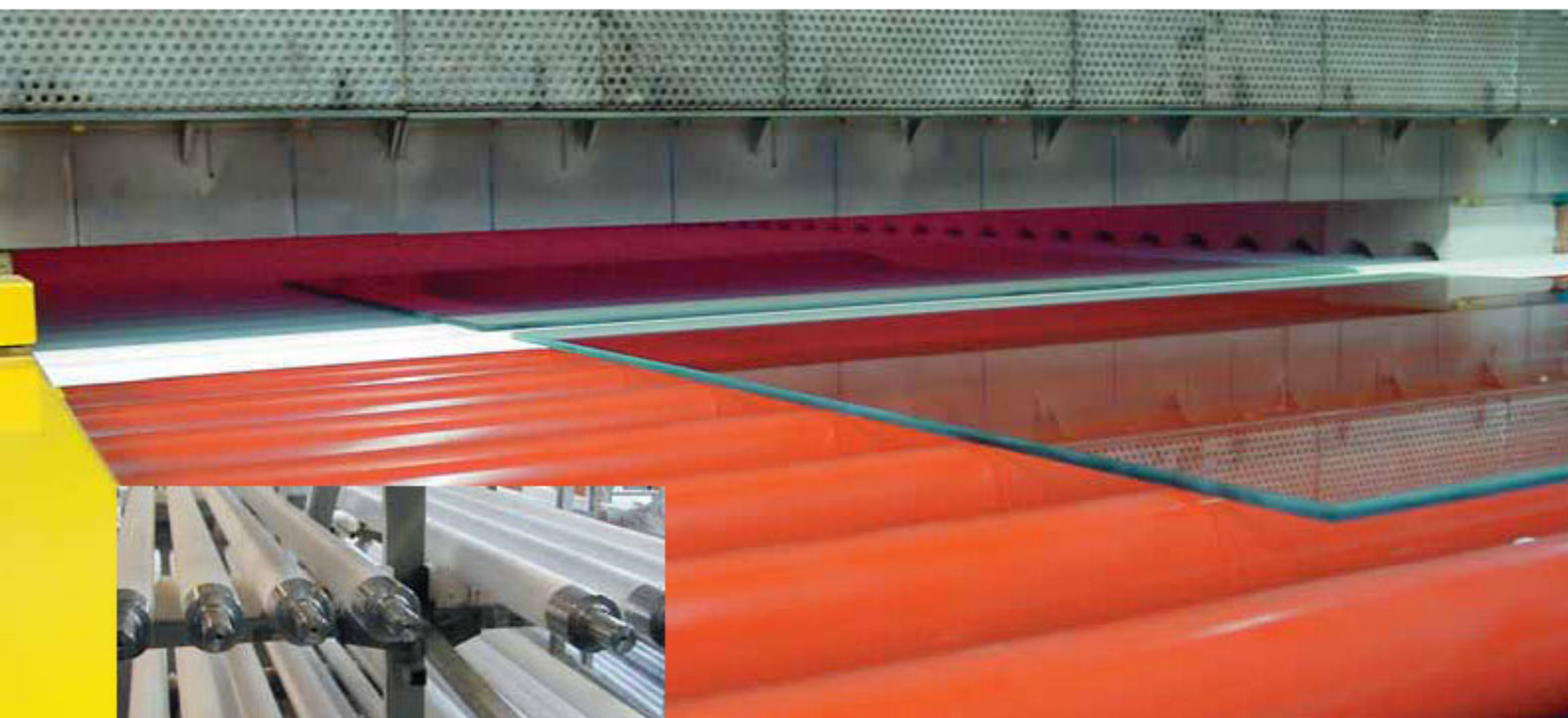
Flachglas auf Quarzgut-Rollen / flat glass on vitreous fused silica rollers