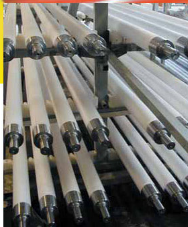
Rollen mit Metallendkappen / rollers with metal end-caps

Quarzgut-Rollen dienen speziell als Transportrollen zum Tempern von Flachglas. Das Verfahren wird bereits seit vielen Jahren zur Herstellung von Sicherheitsflachglas angewandt. Dieses wird hauptsächlich als Architekturglas verwendet, z.B. für Schaufensterglas, Fassadenverkleidung, Glastüren usw. Auch im Fahrzeugbau wird Sicherheitsglas eingesetzt.