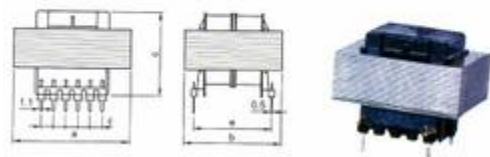
Mjerna skica: Dimensions: