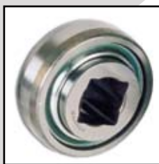
W 209 PPB30