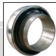
KZIZ - 5.2