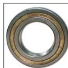
NUP 216 EM.R.C3

- Namena: za kamionski program (Mercedes, FAP, IMT)