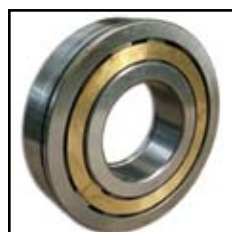
NUP 314 EN.M.C3