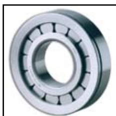
NUP 309 N.VH.C3

- Namena: za kamionski program (FAP i TAM)