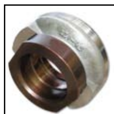
KZI 4,5-37 + NL 57

- Namena: za kamionski program (Mercedes, FAP, IMT)