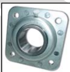
GWST 211 PPB15 (ST 740)