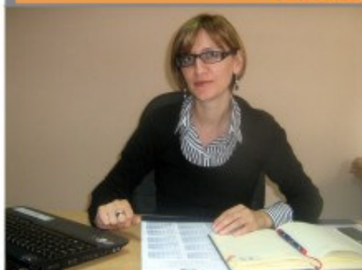
Aktivite të realizuara në bashkëpunim me Odën e zejtarëve Koblenç dhe Kancelarisë Ballkanike për zejtarë dhe ekonomi të vogël

Oda e zejtarëve Koblenç që nga viti 2008 realizon projekt partneriteti për mbështetjen e zejtarisë në Maqedoni. Ka dy partnerë dhe pikërisht Odën e zejtarëve të R. së Maqedonisë si dhe Odën e zejtarëve të Shkupit. Projekti është finansuar nga ana e Ministrisë së ekonomisë dhe zhvillimit nëpërmjet fondacionit SEQUA dhe do zgjasë deri në fund të vitit 2011.