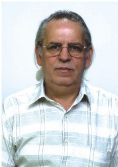
Të nderuar zezjtari,

Zejtaria është një faktor i rëndësishëm për zhvillimin e jetës ekonomike, politike dhe sociale të një vendi.