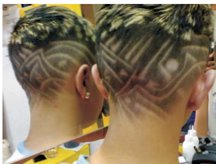
Фризури по вкус на младите

-Јас сум сирак од 1,5 година, а тоа само по себе зборува како сум го минувал детството. Но, секогаш сонувал да бидам човек кој постојано ќе биде во комуникација со луѓето, со нивните потреби за естетика и убавина. Сепак, во раните години имам работено повеќе работи, но, со една цел: да обезбедам услови за да можам да се посветам на фризерскиот занает. Зашто уште од малечок сакав да се занимавам со овој занает. Конечно, од 2000 година започнав да го остварувам својот сон, да се занимавам со фризерскиот занает. Извесно искуство стекнав кога бев во војска, но главно, сум самоук. Јас сметам дека занаеот е, всушност, дар од Бога. Ако за тоа