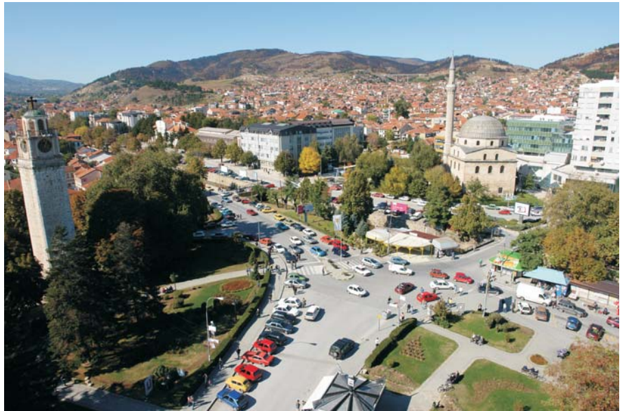
Панорама на Битола

Традицијата продолжува, секако, во заеднички интерес.