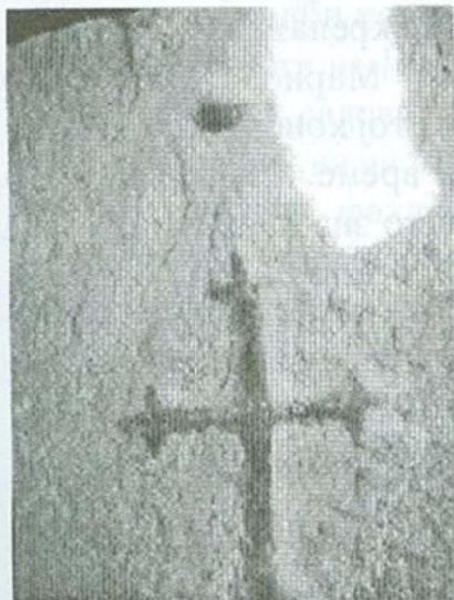
Сл. 11: Крст на еден од гробовите пред Црквата