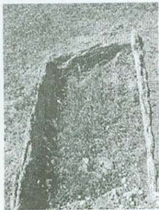
Сл.3: Архајски гроб(?) - Бешиште

Трагите од древното присуство на човекот во атарот на селото Бешиште ги има на голем број места. Вниманието посебно го привлекуваат остатоците од стари некрополи кои ги има на повеќе места, од кои две зафаќаат простор и во самото село, а нивните траги се сосема јасно видливи. Една од некрополите се наоѓа веднаш под самото село, во подножјето на ридот со остатоци од праисториска населба "Врлја Грамада". Дали има некаква врска меѓу некогашната населба и оваа некропола? На површина од околу 500 м 2 расположени се голем број гробови од типот на циста, односно, гробови градени со големи камени плочи. Според големината гробовите упатуваат на претпоставката дека се работи за гробници од архајскиот период (VII-VI век п.н.е.), но без соодветно археолошко истражување е тешко да се утврди од кој период точно потекнува некрополата. На архајскиот период упатуваат нивната форма и големина (сл.3). Имено, се работи за гробни конструкции правени со камени