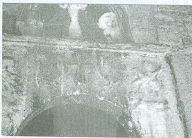
Сл. 10: Релјеф над влезот во црквата

Селската црква во Бешишта "Св. Петка" е зографисана 1884 година 10 . Таа претставува релативно голема црковна градба со трем прилепен за нејзината јужна фасада. Целиот комплекс е забележително архитектонско дело на старите мајстори. Таа се наоѓа на горниот дел на селото, веднаш под првите куќи од источната страна под патот кој влегува во селото. Надворешноста на црквата е доста интересна, посебно ако