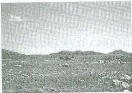
Сл. 2: Врлја Грамада-горе

Освен праисториските наоди во форма на парчиња од керамички садови и остатоци од материјал за градба на куќи (куќниот лепеж), на средината на ритчето е забележлив остаток од некој поголем сид (сл.2), од непознатата градба. За него меѓу жителите на селото се говори дека претставувал некаква набљудувачница, можеби од турско време, но не можеме да ја исклучиме и можноста тој да бил остаток од некое друго време. Освен овој голем сид од камен, видливи се и други грамади и остатоци од градежен камен, како и траги од стари темели по површината на ридот.