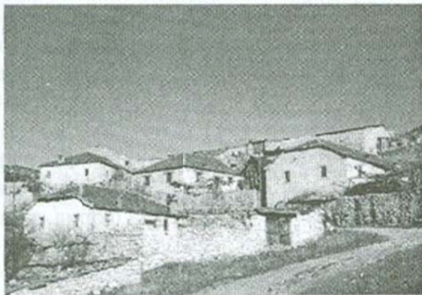
Сл. 9: с. Бешиште

Значи името на селото Бешиште не може да се поврзе со Мариовската буна и потребата да се бега пред турските гонители. За неговото настанување постојат и други преданија. Едно од нив е преданието за извесен Беш(о), кој во некое старо време живеел во Пожарско, денес во Република Грција, односно во Егејска Македонија. Тој имал четворица браќа и по извесно време дошло до поделба меѓу браќата