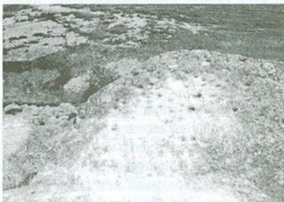
Сл. 5: Кружни длабени форми - локалитет Гробишта

Споменатата некропола не е единствена во селото Бешиште. Овде продуктите на смртта ги има во многу поголем број и на различни места. Остатоци од друга некропола која, веројатно, потекнува и од друго време има и во самото село на источниот крај на патот кој влегува во селото пред денешниот културен дом и во неговата околина. Според раскажувања на жителите на просторот на кој се градел домот во почетокот на педесетите години на минатиот век биле раскопани повеќе грбови во кои се наоѓале и човечки коски. Според