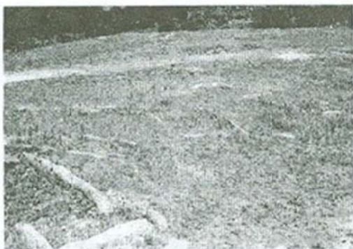
Сл. 4: Грбови-локалитет Гробишта

ни процесии и ритуали поврзани со третманот на покојниците, но тоа, сепак, е тешко да се тврди. Единствено можеме да претпоставиме дека се работи за длабнатини кои во времето од кое потекнуваат гробовите се длабеле во каменот за принесување извесни жртви во чест на покојниците, и можно е да се работи за обичај за секој нов покојник да се длабела и нова кружна длабнатина. Во секој случај денес оваа камена површина претставува мистична порака од древнината која заслужува внимание од страна на научната јавност зашто може да доведе до нови значајни сознанија. Фактот дека вакви длабени форми можат да се видат на голем број места низ Мариово и низ други области во Македонија уште повеќе го потврдува нивното значење.