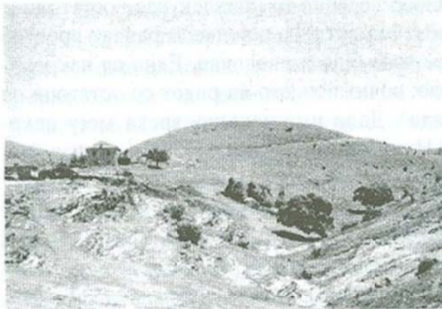
Сл. 1: Врлја Грамада

Просторот околу селото Бешиште денес е главно, голема и каменеста голина со широки рамнини и долини од двете страни на Бешишка Река (Здравечки Дол), која го дели селото на два нееднакви делови. Сепак, на површината на теренот на кој е поставено денешното село и околината можат да се забележат голем број траги од населување во различните периоди на историјата. Во атарот на ова село има траги и од населби од најстарите периоди на човечкото постоење, посебно новото камено време. Една таква населба била лоцирана на денешното ритче јужно од Бешиште кое се наоѓа на само стотина метри од селото преку рекчето. Тоа е познато меѓу жителите како "Врлја Грамада" (сл.1).