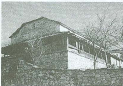
Сл. 8: Црквата во с. Бешиште