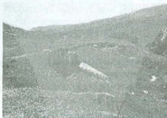
Сл. 6: Локалитет Гробишта

археолозите оваа некропола потекнува од средниот век. Таа е расположена на навистина голема површина бидејќи гробови има и на неколку стотици метри од тука на локалитетот познат како "Турчија" кој денес го обележува еден турнат споменик од Првата светска војна со натпис на германски јазик.