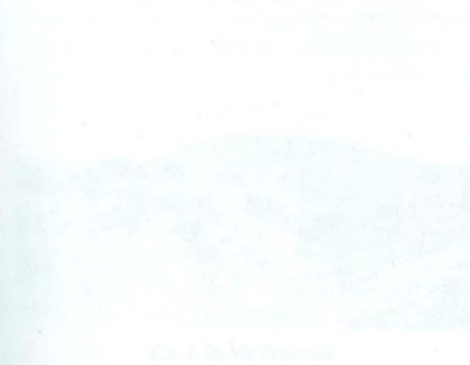
Сл. 4. Мариово

Мариово било во територијата на која дотогашно време живееле славјаните, а потоа и славјаните кои се појавиле во историјата. Во историјата има само една држава во Мариово, а тоа е Мариовската држава на Балканот во средновековието. Мариовската држава се наоѓала во Мариово и Меглен, а нејзиниот центар бил во Мариово. Мариовската држава се наоѓала во Мариово и Меглен, а нејзиниот центар бил во Мариово. Мариовската држава се наоѓала во Мариово и Меглен, а нејзиниот центар бил во Мариово.