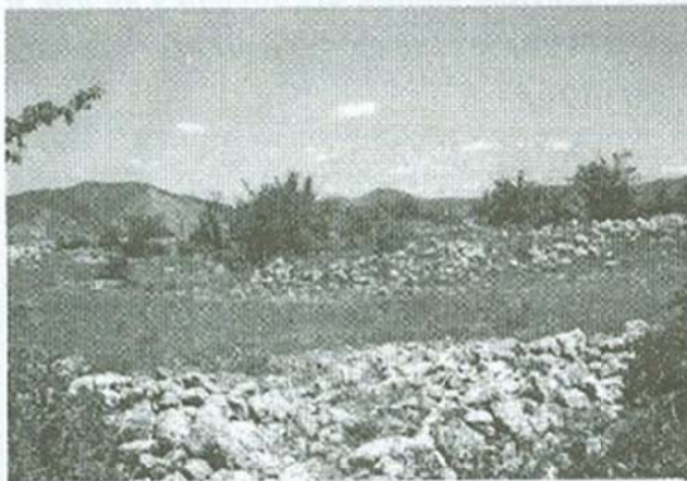
Сл. 7: Грамади камења-локалитет Оградјето

от простор од неколку хектари по површината се среќаваат и други остатоци од старата населба. Меѓу нив фрагменти од покривна керамика, фрагменти од керамички садови, парчиња од згура од толена железна руда и сл. Според археолозите овие остатоци упатуваат на постоење населба во средниот век 2 .