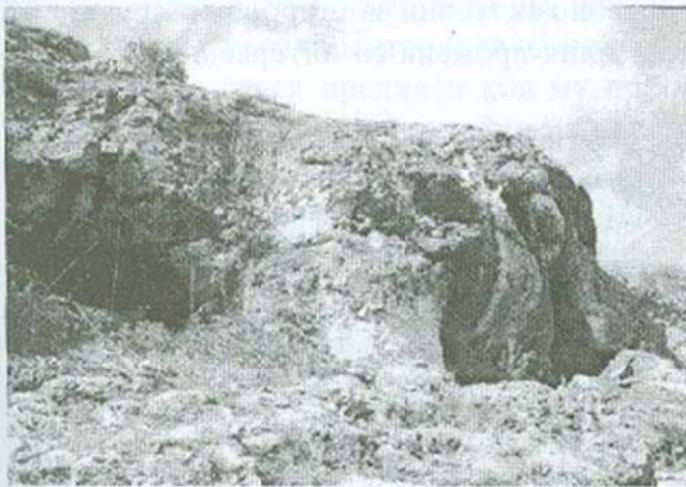
Сл. 12: Пештерите под Рамнобор

Денес нема населба на местото на старото запустено село Мелница кое са наоѓа на пет километри пред селото Витолиште во Мариово. Неговиот атар, сепак е познат за жителите на околните села бидејќи некогашните жители на Мелница се преселиле, главно, во нив. Во просторот кој му припаѓал на некогашните жители на Мелница денес се среќаваат голем број траги од древно постоење кои нè водат дури и до најдлабоката праисторија на постоењето на човекот.