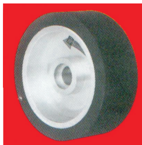
Тип А666 НТ гумен контакт прстен мазен модел