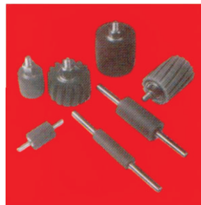
Мали специјални контактни прстени