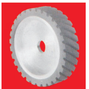
Тип А100 - Високо еластичен НТ Plastiflex контакт прстен со пенлив слој со жлебови