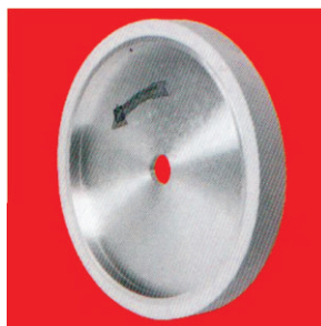
Тип А9 НТ високо еластичен Plastiflex контакт прстен со мазен слој и алуминиум центар