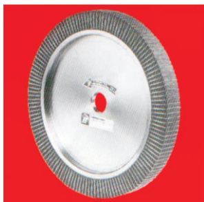
Тип А15 НТ екстра флексибилен текстил/пена контакт прстен на алуминиум центар