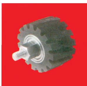
Тип А77 - Мал контактен прстен НТ ребрест прстен со осовина и навој