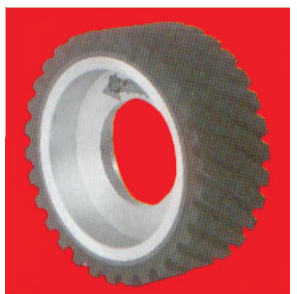
Тип А11 НТ Plastidur контакт прстен со брусен слој и алуминиум центар