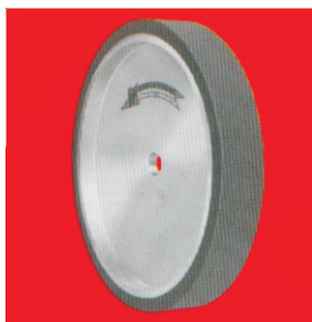
Тип А66 НТ гумен контактен прстен, мазен модел