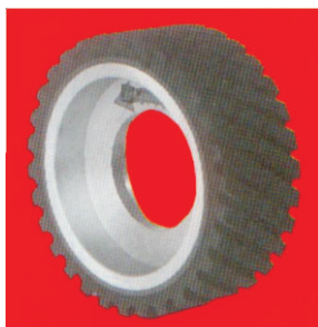
Тип А11 НТ Plastidur контактен прстен со брусен слој и алуминиум центар