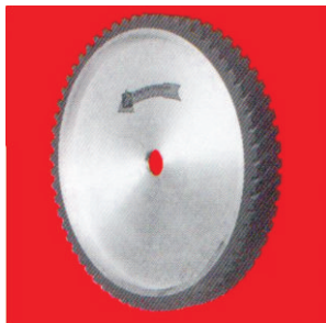
Тип А77 НТ гумен контакт прстен со жлебови