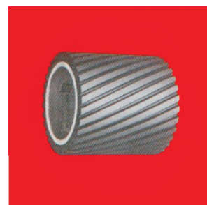
Тип А777 НТ гумен контакт прстен со жлебови