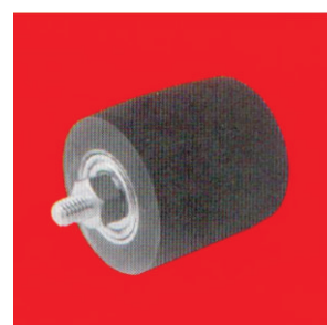
Тип А66 - Мал контактен прстен НТ мазен гумен слој со осовина и навој