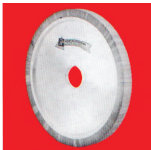
Тип А14 НТ високо флексибилен Permaflex контактен прстен со пенлива кора и алуминиумски центар