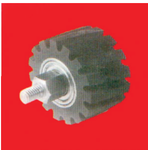
Тип А9 НТ високо еластичен Plastiflex контактен прстен со мазен слој и алуминиум центар