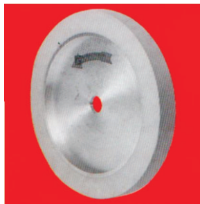
Тип А10 - Високо еластичен НТ Plastiflex контакт прстен со мазен пенлив слој