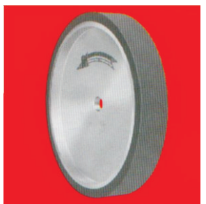
Тип А66 НТ гумен контакт прстен, мазен модел