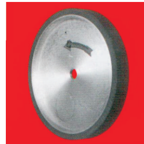
Тип А8 НТ Plastidur контакт прстен со мазен слој и алуминиум центар