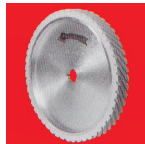
Тип А90 Различна тврдина на слојот, специјален контакт прстен