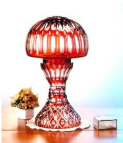
Grupa 24 - Svecnjaci i lampe

Srpska fabrika stakla proizvodi i staklo za ugostiteljstvo: