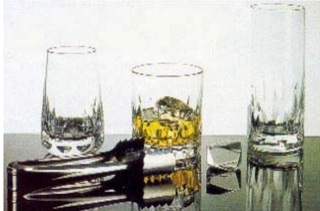
Grupa 11 - Case obicne