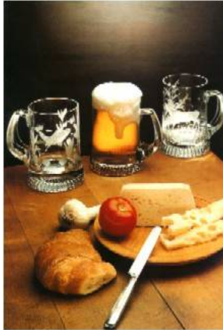
Grupa 15 - Krigle