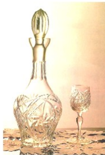
Grupa 18 - Servisi za pica, slatko, setovi i boce