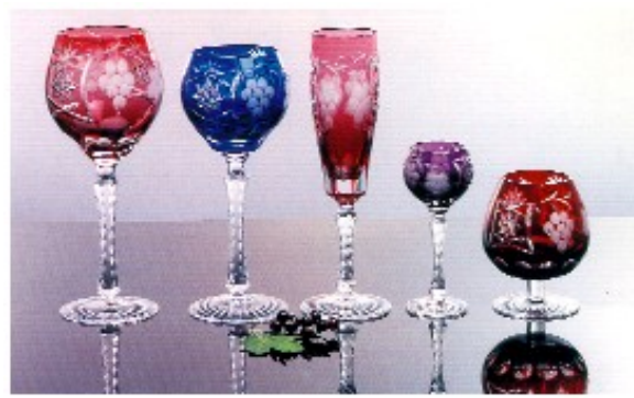
Grupa 13 - Case stolovate

Majstori Srpske fabrike stakla danas spadaju u malobrojne u Evropi koji proizvode najfiniji olovni kristal iz dva sloja, u dve boje - takozvani "iberfang".