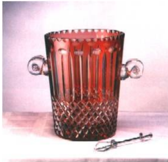
Grupa 28 - Bole, razne posude i boce