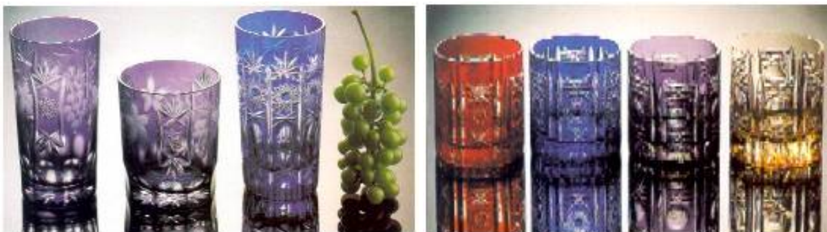
Grupa 11 - Case obicne

I pored brzog razvoja tehnologije i automatizacije, rucno proizvedeno trgovacko staklo i dalje je nezamenljivo i kao ukras i kao predmet za svakodnevnu upotrebu.