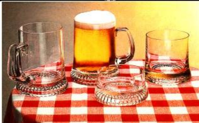
Grupa 18 - Servisi za slatko, pica, setovi