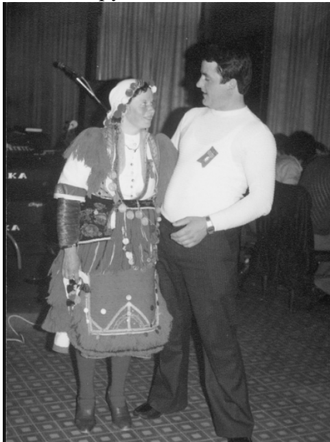
Мома ѓред мажење

здравје и среќа на младенците, за послушност на невестата во новата куќа итн. Невестата ги дарува и роднините и пријателите на зетот по ручекот во неговиот дом.