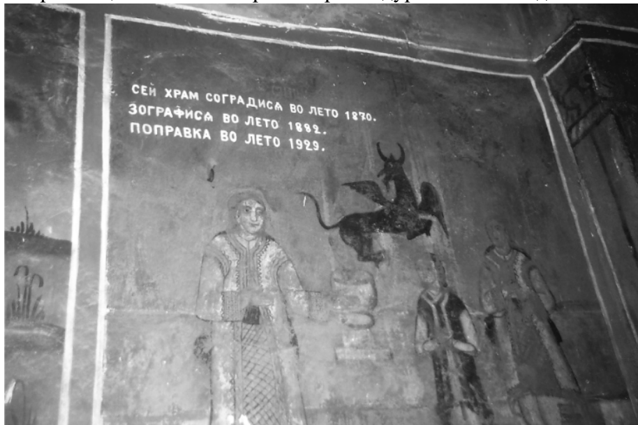
Внатрешна сирана на црквата (фрески и набележан датум на зографисување и поправка во 1929 година)

По враќањето на населението од интернацијата била поправена, со поголемо реновирање дури во 1929 година.