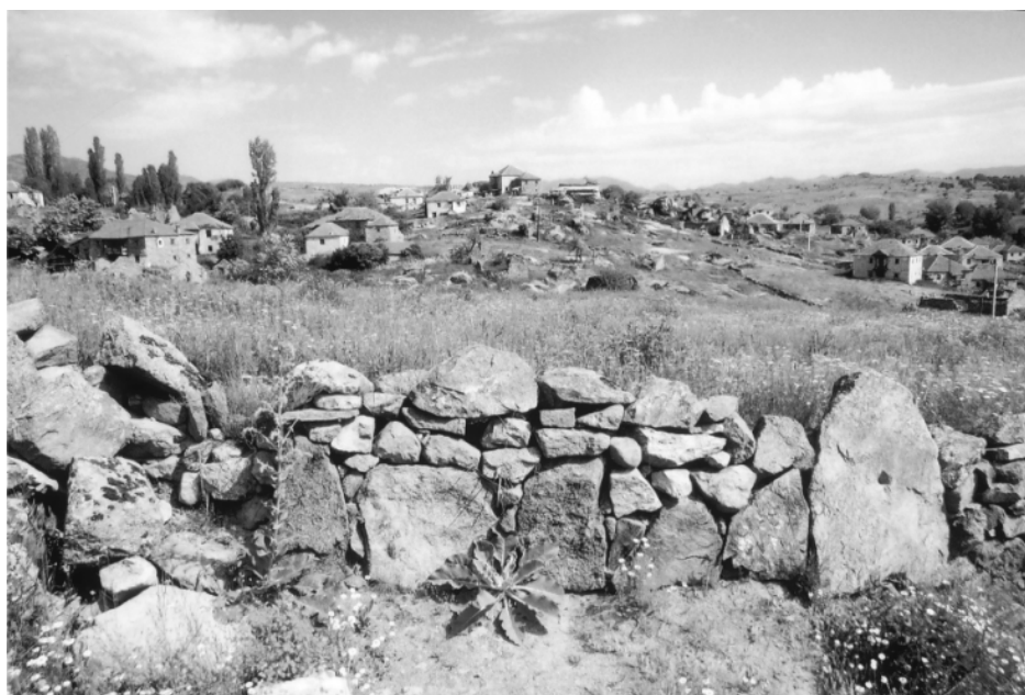
Камена ограда околу дворови, ниви, ливади,

Животот на луѓето во Чаниште, по враќањето, започнал од почеток. Никој немал ништо. Зимата била на прагот (било средезима во 1918 г.) и штотуку почнале снеговите и студот. И во оваа прилика напомош му доашле соседите. До консолидирањето на срската власт, со парите што ги донесле со себе купувале она што во почетокот му било најпотребно. Материјалот што останал од војната, на фронтот (штиците, греди, ламарини, железа и сл.) бил од голема корист за обновување на куќите, колку да се помине првата зима.