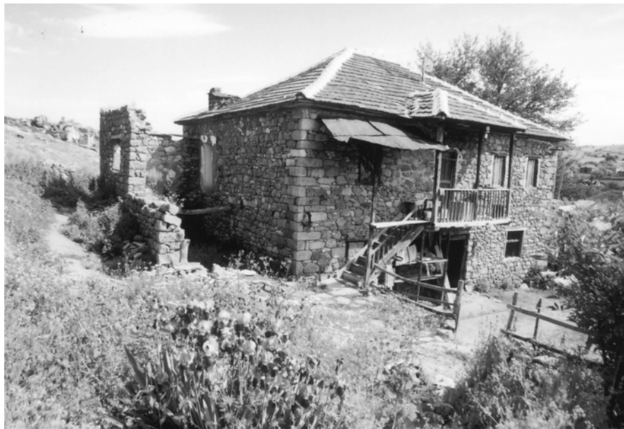
Куќа во с. Чаниште од "современ тип"