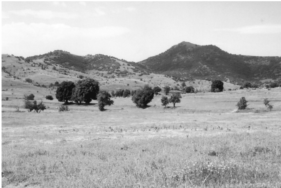
Висовиџе каде била биџкаџа на Ѓорче Пеџров со Турџиџе