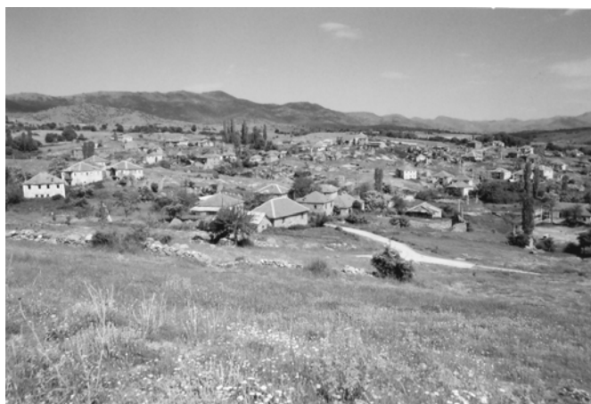
Панорама на Горно маало, с. Чаниште