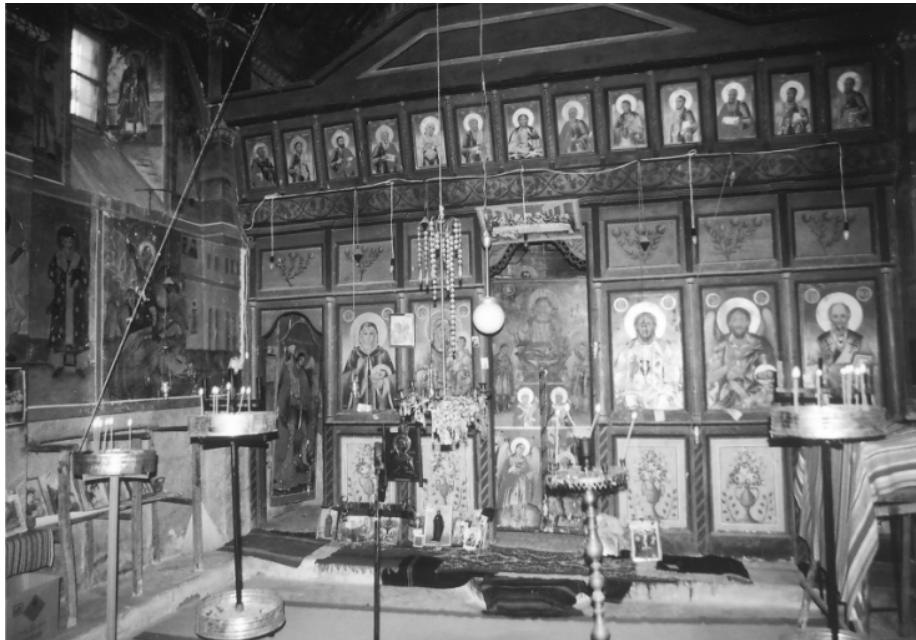
Иконосџасоџ на храмоџ Свеџа Пеџка, реновиран 1929 џ.

Славата на селото е Пејковден , се слави на 27 октомври. Во старото село, а на почетокот и во новата локација на селото, славата била „Света Петка“. Бидејќи овој празничен ден бил среде летниот период кога биле во полн ек полските работи, посебно вршидбата, а чести биле и годините кога немало доволно вода, славата се заменува со Пејковден .