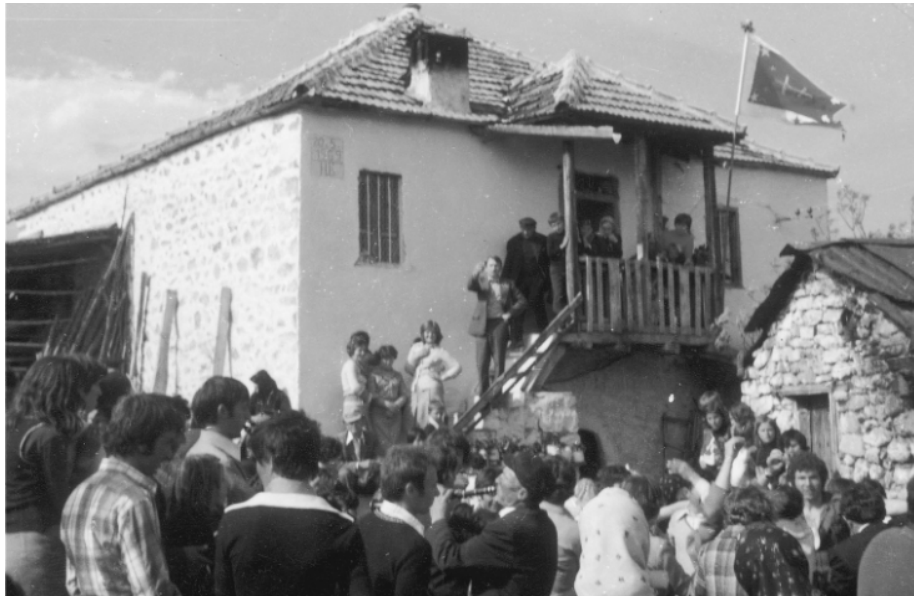
Една од последниџе свадби

Во текот на свадбата има и многу други обичаи, меѓутоа поради просторот и целта на темата се дадени само најосновните црти што ја карактеризираат една свадба.