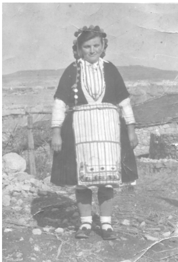
Помалку свечена народна носија

Женската народна носија се состоеше од свечена и секојдневна. Машката носија е напуштена, не се носи околу 50 години или поточно таа се носеше некаде до 1930-1940 година. Женската носија се носеше некаде до 1960 година.