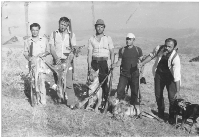
Ловци со уловен дивеч во атароџи на с. Чанишиџе

Поради лошите климатски услови, животинскиот свет не бил многу распространет. Од дивите животни најмногу ги имало волкот, лисицата, зајакот и др. Мечка и дива свиња на овој простор никогаш немало. Од птиците ги имало чавките, страчките, гарванот, орелот, соколот и сите видови на врапци и сколовранци.