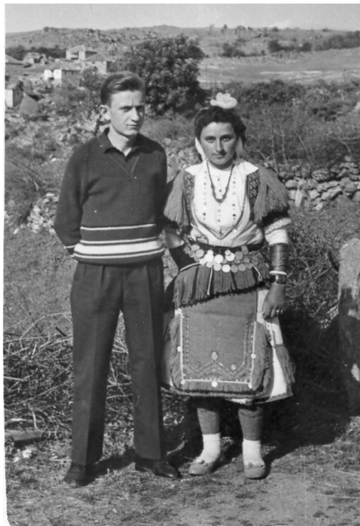
Ерџен и мома на Велигден

Како и секаде се вапцуваа црвени јајца. Посебна атракција меѓу децата беа вапцаните црвени јаребичкини јајца. За таа прилика овчарите пред Велигденот по грмушките низ полето бараа јаребичкини јајца.