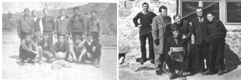
Учениџи од с. Чанишиџе со оддел. раководиџел во 1966 џод.

Поради минималниот број учениџи, во учебната 1989/90 година, се укинаа паралелките од V-VIII одд. и престана училиштето како осмолетка. Од учебната 1991/92 година се укинаа паралелките од I-IV одд. кога училиштето сосема престана со работа. Денеска училишната зграда е празна и напуштена.