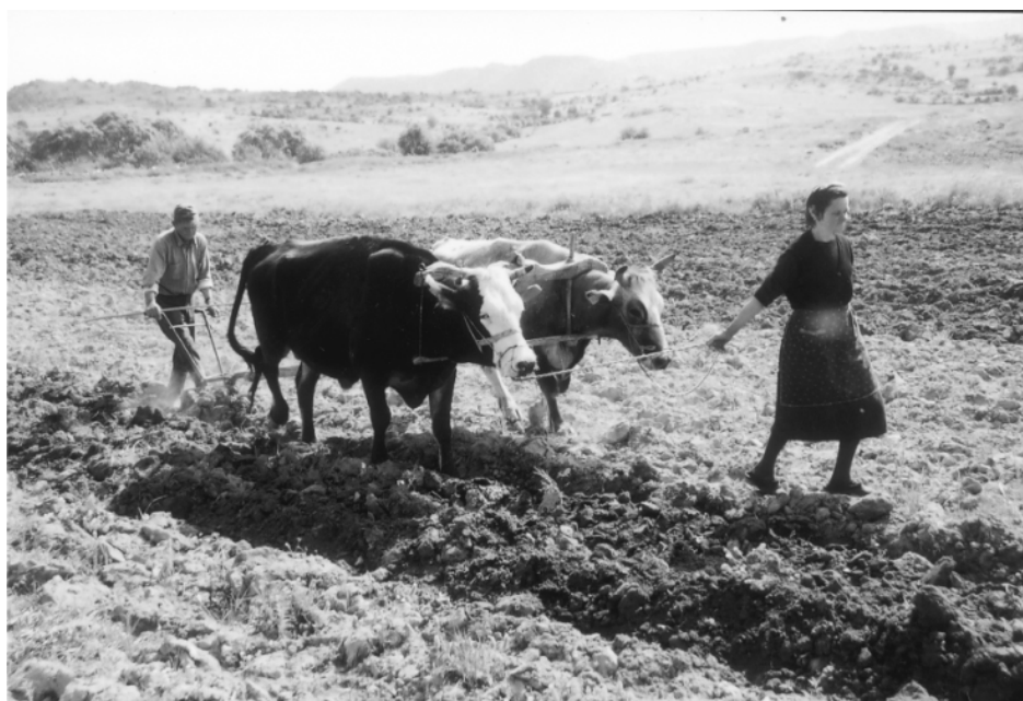
Примитивна обработка на нивите (орање некогаш и денес)

Земјоделските работи се вршеле со прирачни земјоделски средства. Се орало со плуг и рало, се копало со мотика и дурија и лопата, се жнеело со срп, а како превозно средство се користеа воловски запреги, коли. Вршењето се вршеше во гумната со коњи.