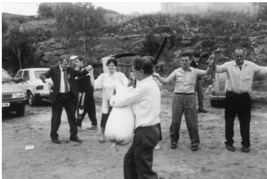
Оро на средсело

Велигденот, Божикот и Дуовденот се славеа 3 дена. Првиот ден се одеше во црква слично како за Божик, со тоа што тепсиите беа со јагнешко месо. Трите дена по пладне имаше средсело со гајди или кларинет и тапани. За Велигден обично за секого во домаќинството се купуваше ново, облека, чевли и слично за носење, посебно за децата. За Дуовден за душа на починатите, се дава бардиња.