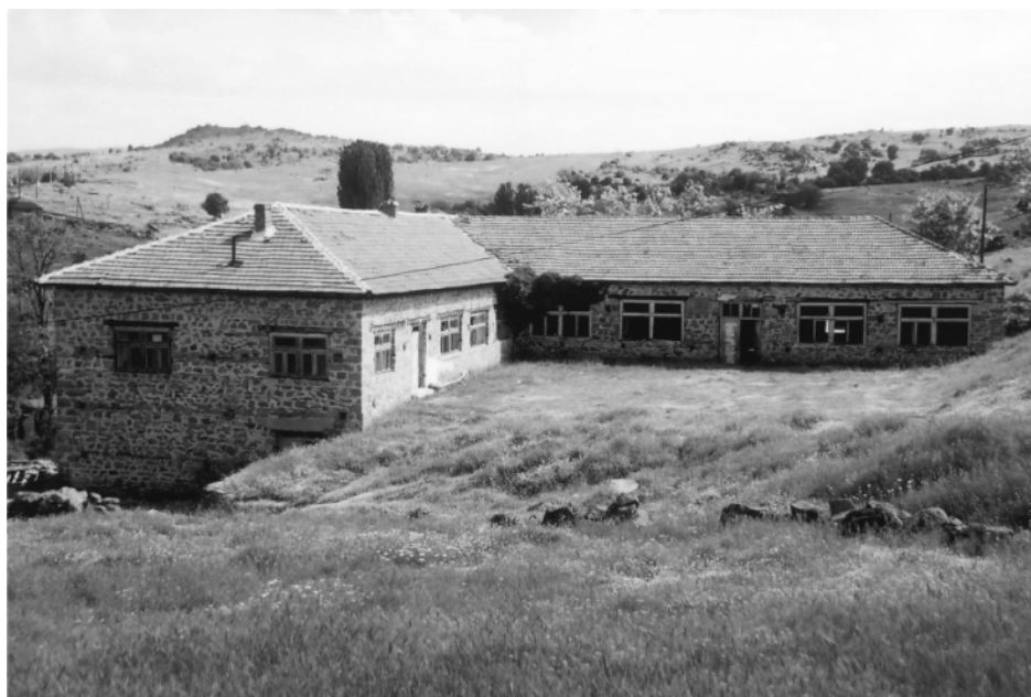
Новата зграда на училиштите, градена по НОБ

Осмолетката започна со работа во новата училишна зграда. Беше градена во период од 1958-1960 година, а се доградуваше и подоцна. Се градеше со помош од населението, преку ударнички денови, а секое домаќинство беќе задолжено да донесе 5-6 кубници камен. Општината во Манастир со одобрените парични средства од околу 4 милиони тогашни динари ги подмируваше трошоците за покривање, за доградата, за мајсторите за зидање и слично.