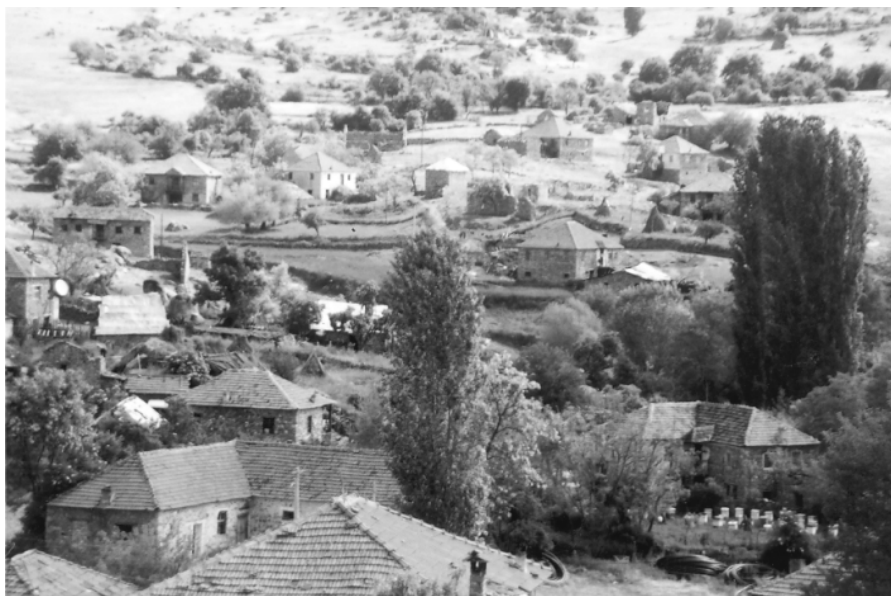
Панорама на Ѓеневско маало, с. Чанишиџе