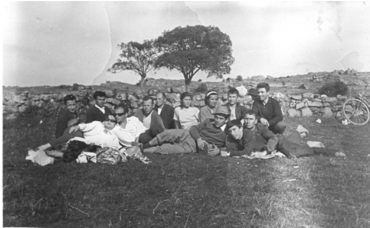
Насџавничкиоџ кадар на џролеџен излеџ во 1966 џод.

Поради минималниот број учениџи, во учебната 1989/90 година, се укинаа паралелките од V-VIII одд. и престана училиштето како осмолетка. Од учебната 1991/92 година се укинаа паралелките од I-IV одд. кога училиштето сосема престана со работа. Денеска училишната зграда е празна и напуштена.