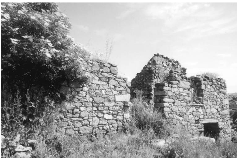
Куќа во рушевини, градена предПрватаа светска војна, ѕидана со камен и покриена со ржаница

Селата во т.н. старо Мариово (преку реката Црна) се градени со т.н. собран тип. Селата од т.н. ново Мариово (пред Црна Река) се градени со истурен тип. Тоа се должи на фактот што во овие села, покрај куќата, близу се и останатите придружни објекти, како што се плевните, амбарите, фурни, и др. Во тој тип на село е и Чаниште.