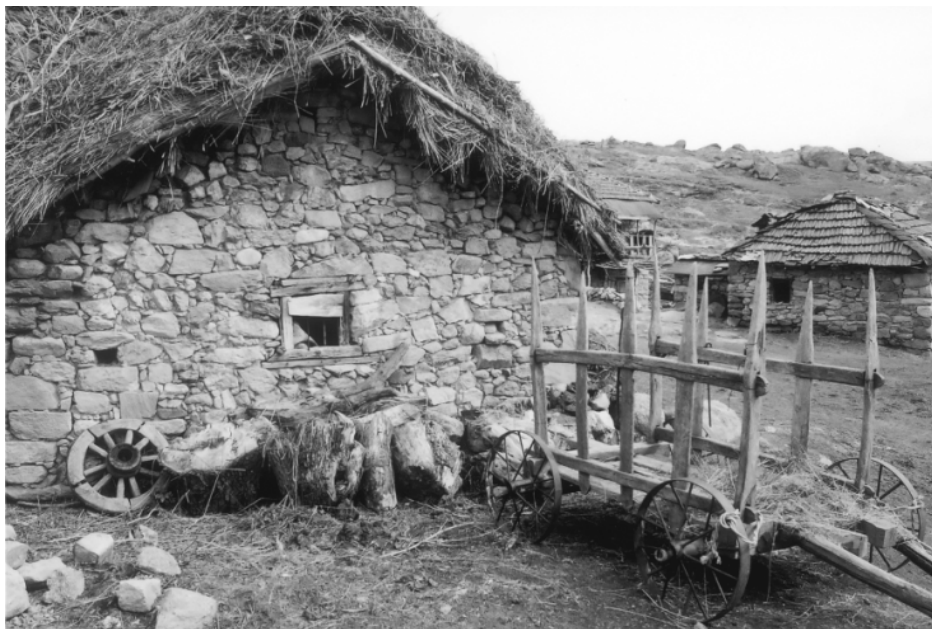
Селска дрвена кола со сојци за превоз на жиџо и др.

Овоштарство во вистинска смисла на зборот и не постоеше. Никој не поседуваше овошна градина. Во најголем дел како природни овошки се користеа сливите и крушите распространети низ полето и нивите. Народот ги употребуваше за јадење во природна сочна состојба во екот на земјоделските летни работи, и како сушенки за компот преку зимата. Од сливите и крушите се варело ракија. Од крушите се застапени т.н. круши-горници. Имаше и калем - наречени присади. Во 60-те год. од XX век со ученици од Средното земјоделско училиште од Битола во Мариово имаше акција за калемење на дивите круши. Исто така имаше акција и за пошумување. Секако дека успесите беа на бараната висина.