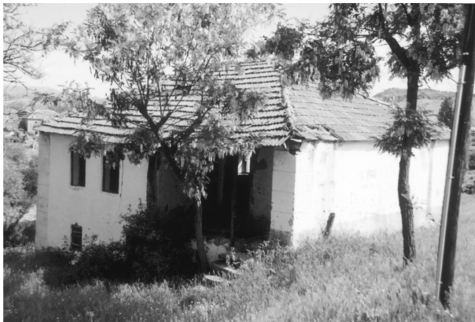
Сџараша зграда на училиштитето во с. Чаниште