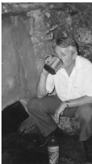
Студена и пијка вода на кладенецој "Чаирои"

По течението на реката посебно под селото имало многу воденици за мелење брашно за исхрана на луѓето и пребој за добитокот. Водениците биле самостојни или заеднички за неколку домаќинства. Така на пример биле познати: Селската воденица, Поповата воденица итн. Најмногу воденици имало под селото, од бучалото, па сè до Младенова воденица.