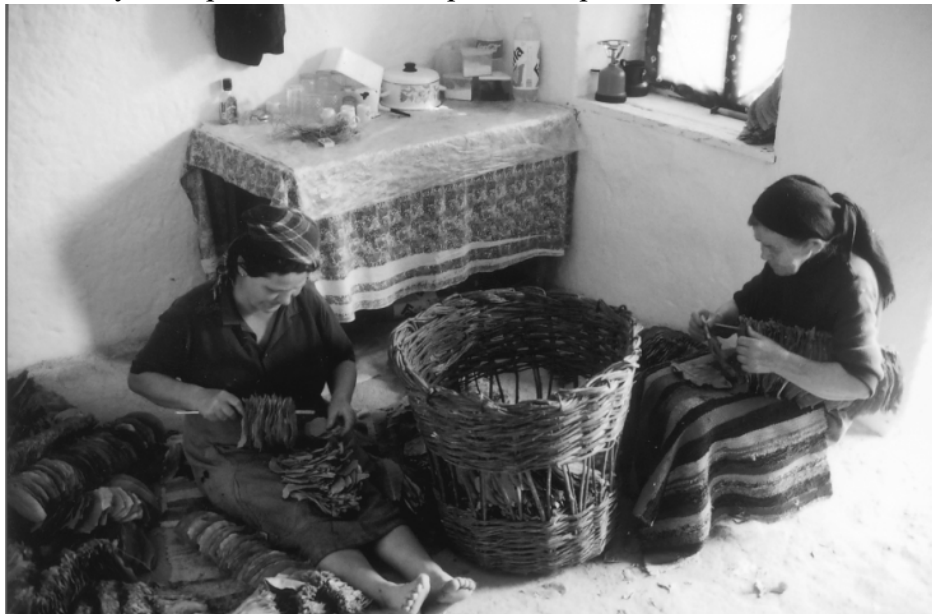
Нижење на џуџун

За да се заработа парични средства се одгледуваше тутун со многу добар квалитет од сортата „Прилеп“.